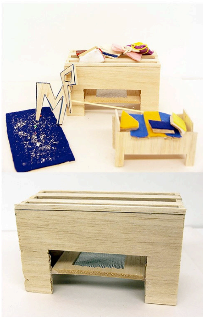
Εικόνα 4: Πρωτότυπο κάθισμα βασισμένο στη φράση «Κάθομαι σε αναμμένα κάρβουνα»

Από όλη την παραπάνω διαδικασία έχει συλλεχθεί αρκετό υλικό για την ομάδα ικανό να οργανωθεί ώστε κάθε συμμετέχοντας να αρχίσει να συνθέτει το επιθυμητό αντικείμενο υπό κλίμακα. Η εισαγωγή της κλίμακας στο σχεδιασμό εμπλουτίζει τη συνθετική σκέψη των παιδιών τόσο με μετρικά και τεχνικά μεγέθη όσο και με αισθητικά και ψυχολογικά (Τσουκαλά 2000: 7-10). Στη διαδικασία συσχέτισης με την κλίμακα συμμετέχουν ανδρείκελα ώστε να υπάρχει ένας «κοινός τόπος» μεγεθών.