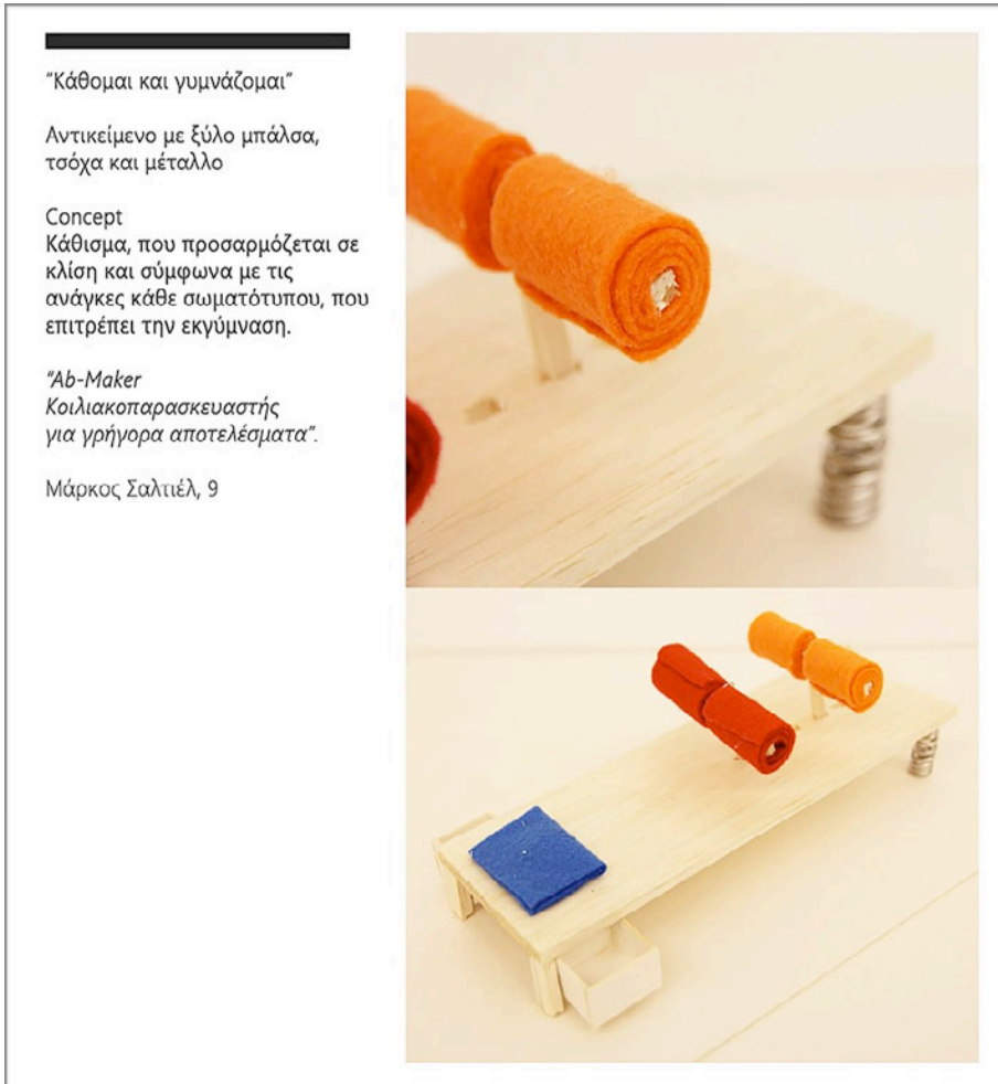
Εικόνα 5: Πρωτότυπο κάθισμα βασισμένο στη φράση «Κάθομαι και γυμνάζομαι»