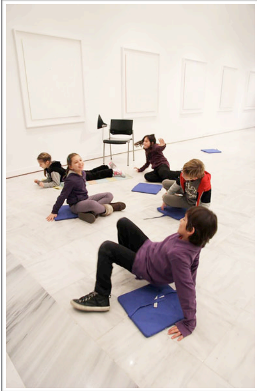
Εικόνα 2: Παιχνίδι αξιοποιώντας το σώμα και φράσεις - κλειδιά (bodystorming)

Ο καταιγισμός ιδεών συνεχίζεται με ένα ακόμη κινητικό παιχνίδι αξιοποιώντας το σώμα που θα αποδώσει φράσεις-κλειδιά 'bodystorming' (Εικόνα 2). Η ομάδα συνεχίζει με σκίτσα και νέες ιδέες που αποτυπώνοντας τους «τρόπους να κάθεται» στο πλαίσιο του 'brainstorming with rules' (Εικόνα 3).