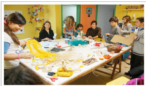
Εικόνα 1: Επιλογή κατάλληλης στάσης σώματος και υλικών, που εξασφαλίζουν άνεση και αντοχή

Στο πλαίσιο της παρατήρησης και των ερωταποκρίσεων εισάγονται όροι χρήσιμοι στο σχεδιασμό όπως η ‘εργονομία’ και η ‘ανθρωπομετρία’. Από μια ευρεία συλλογή υλικών επιλέγονται τα επιθυμητά υλικά από κάθε παιδί ενώ παράλληλα διερευνάται η κατάλληλη στάση σώματος. Επιδιώκονται οι συνδυασμοί υλικών και στάσης σώματος που να εξασφαλίζουν άνεση και αντοχή (Εικόνα 1).